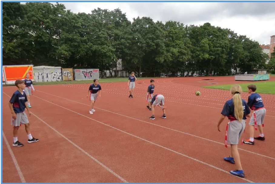
Abbildung 2: Beim Einüben der Spielzüge